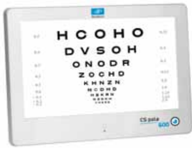
CS POLA 600